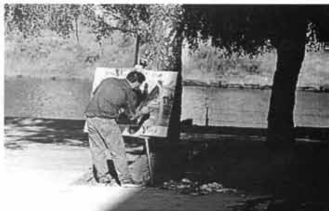
Concurso Nacional de Pintura Valdivia y su Río

Dentro de las actividades desarrolladas por la Corporación Cultural Municipal destacan el Concurso Nacional de Pintura Valdivia y su Río, el Concurso de Cuentos