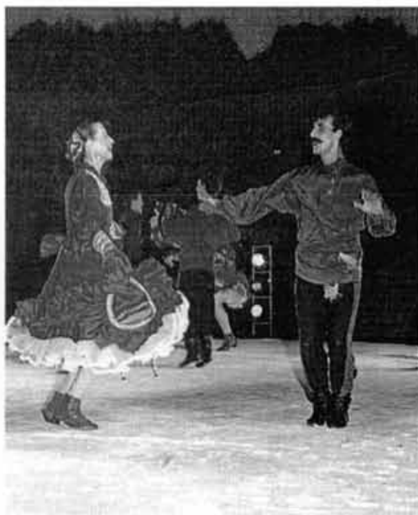
Ballet Ruso Moiseyev

Con 17 años de existencia, constituye uno de los eventos más importantes en el medio cultural, debido a su carácter no competitivo, permite mostrar el desarrollo de las