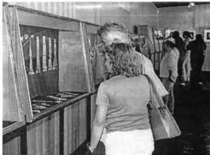
Exposición de Platería Mapuche