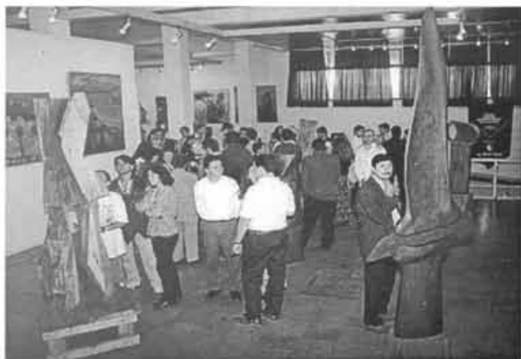
Simposio Internacional de Escultura

La Corporación Cultural Municipal de Valdivia, celebra su noveno año de existencia apoyando la creación artística de la provincia.