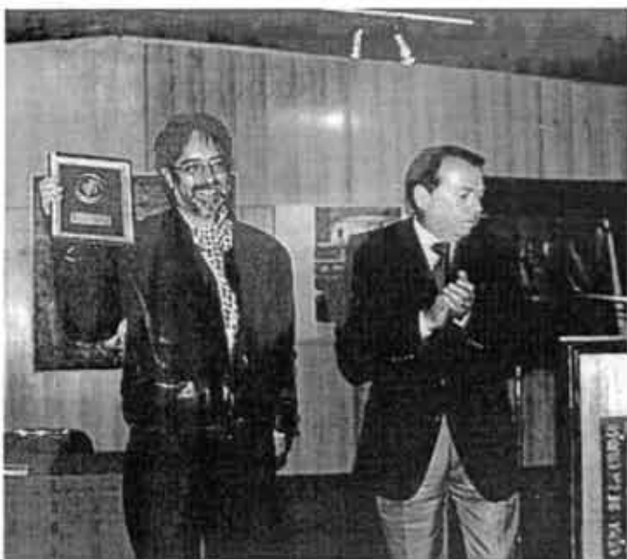
Premiación Concurso de Cuentos Fernando Santiván.

Fernando Santiván, los Proyectos Conarte y múltiples eventos culturales que son organizados durante el año.