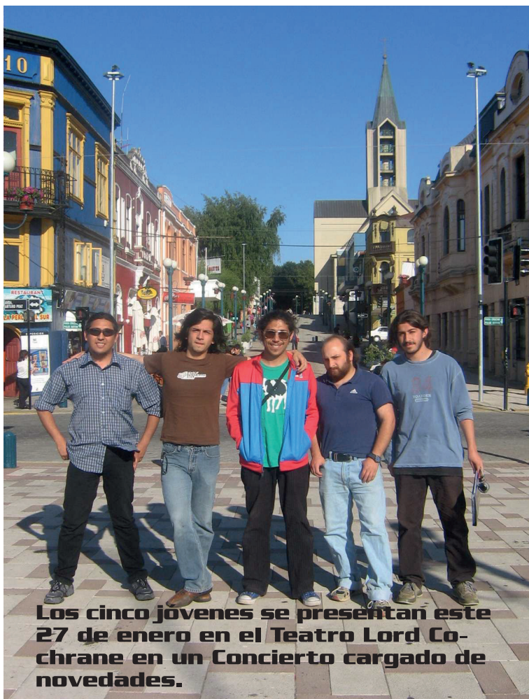
Los cinco jóvenes se presentan este 27 de enero en el Teatro Lord Cochrane en un Concierto cargado de novedades.

Para los integrantes de Heart Attack las razones para hacer una banda tributo a Queen son varias. "Es una banda que ha marcado toda mi vida,