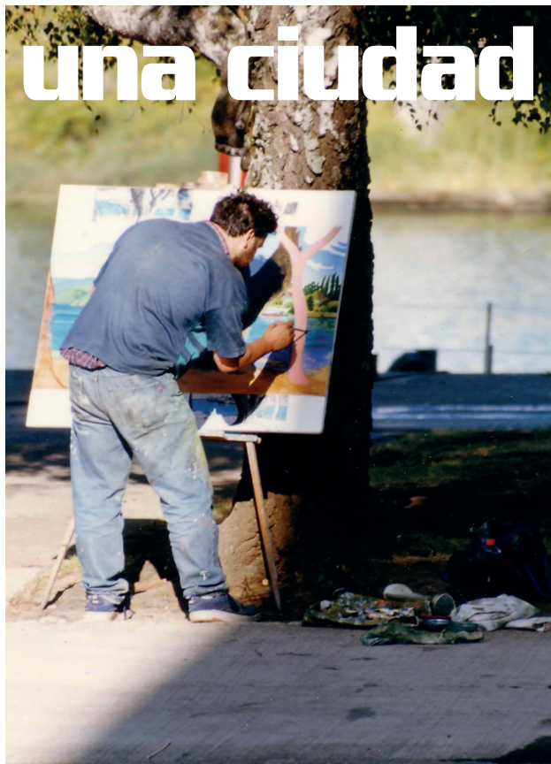
Pintando en la costanera

pictóricas del país- los participantes de “Valdivia y su río” deben realizar sus obras in situ, vale decir, en Valdivia y sólo durante los días que dura el concurso. Si hablamos de sus atractivos éste debería ser uno de los más importantes.