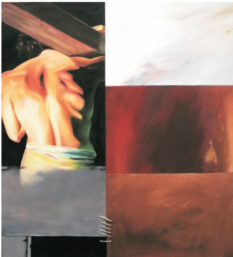
Símbolo y realidad

En la necesidad de compartir una expresión personal que aspira a ser leída de la forma en que fue concebida, el artista encuentra la motivación que guía sus creaciones: “Las obras surgen a partir de mi intención de