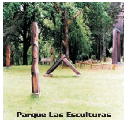
Parque Las Esculturas

25 esculturas contemporáneas de gran formato en piedra, metal y madera, de artistas chilenos y extranjeros, ubicadas al aire libre y rodeadas por un bello entorno natural, junto a la Laguna de los Lotos. Durante este mes también es posible visitar las once obras resultantes de la última versión del Simposio Internacional de Escultura de Valdivia –realizado durante el mes de febrero- y que prontamente serán integradas a distintos lugares del radio urbano de la ciudad. (Parque Saval, Isla Teja / sólo se paga entrada al Parque Saval)