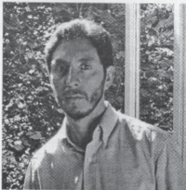
Ojos bien abiertos

estaba ambientada en Valdivia, una persona de la ciudad se sintió retratada y uno de sus parientes se acercó para decirme que yo había utilizado el personaje para crear otro y que, además, lo dejaba muy mal. A partir de esa idea pensé qué le sucedería a un escritor si en una conferencia de prensa se le apareciera un personaje que él mismo ha inventado. Esa es la anécdota, pero en el fondo es una reflexión sobre el artista y el arte.