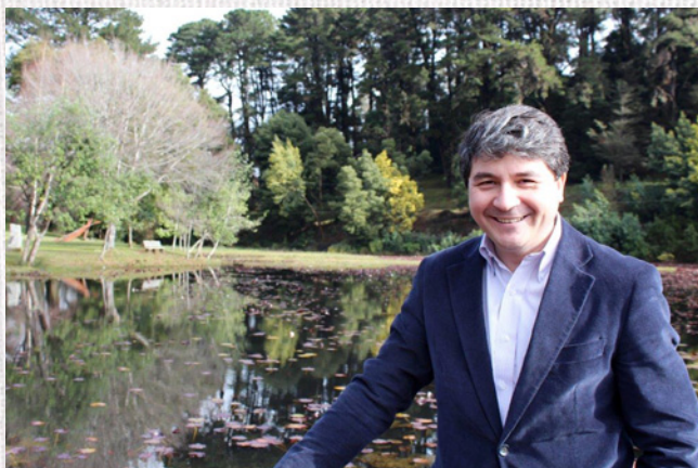
Omar Sabat Guzmán ALCALDE DE VALDIVIA - PRESIDENTE CCM

De manera exitosa finalizó la campaña de elección y promoción “10 Pinturas Universales en Chile”, que el Bureau Internacional de Capitales Culturales y la Municipalidad de Valdivia realizaron con motivo de la Capital Americana de la Cultura Valdivia 2016 y que contó con el apoyo del Consejo Nacional de la Cultura y las Artes.