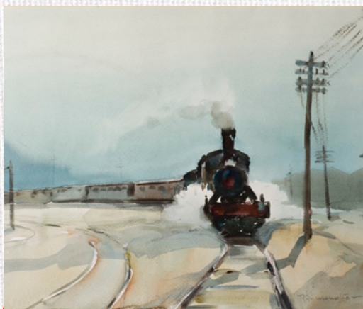
“Locomotora”, Ricardo Anwandter.

Más de cinco mil personas de todas las regiones chilenas participaron en la elección con un total de 46.516 votos emitidos. El 61,27 % de los votos ha sido emitido por mujeres, mientras que el 38,73% restante por hombres