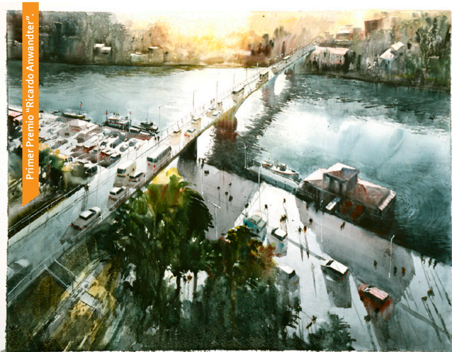
Primer Premio "Ricardo Anwandter".