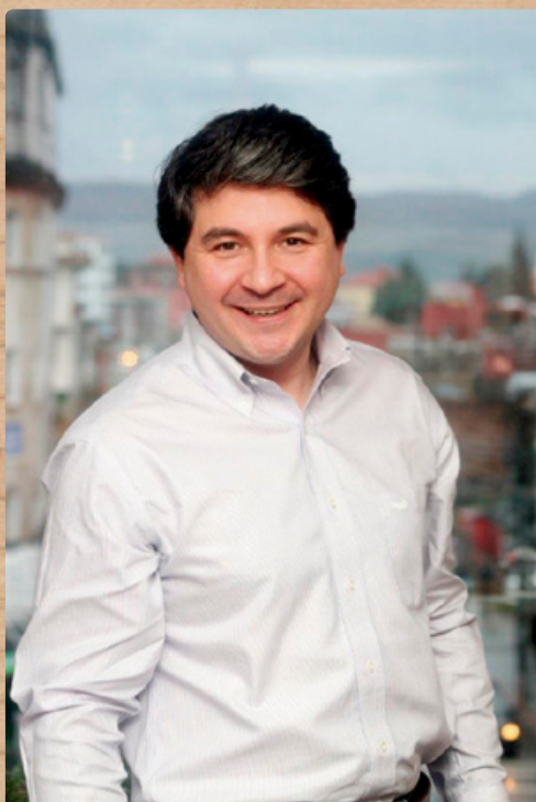
Omar Sabat Guzmán ALCALDE DE VALDIVIA - PRESIDENTE CCM

D espués de un Verano en Valdivia muy exitoso, tanto en el marco de visitantes como por las actividades desarrolladas que consolidan a nuestra ciudad como un atractivo turístico y como un polo cultural en el sur de nuestro territorio, nos corresponde iniciar el calendario tradicional de actividades culturales al alero de nuestra Corporación Cultural y que este año se enmarca en la designación de Valdivia como Capital Americana de la Cultura 2016.