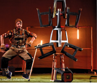
Lluvia de teatro infantil