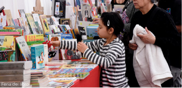
Feria del libro