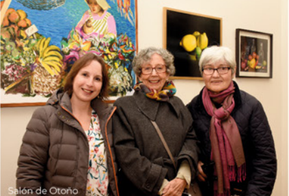
Salón de Otoño