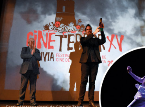
Festival Internacional de Cine de Terror