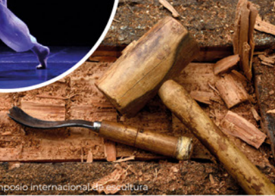
Simposio internacional de escultura