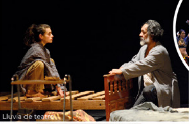
Lluvia de teatro