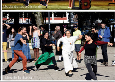
Mes de la danza