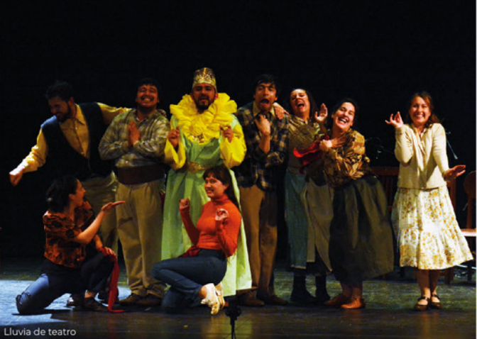
Lluvia de teatro