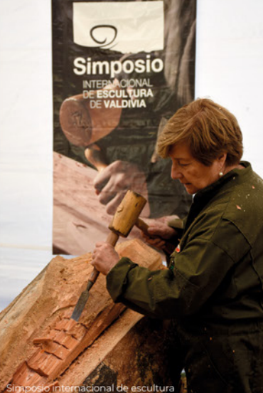
Simposio internacional de escultura