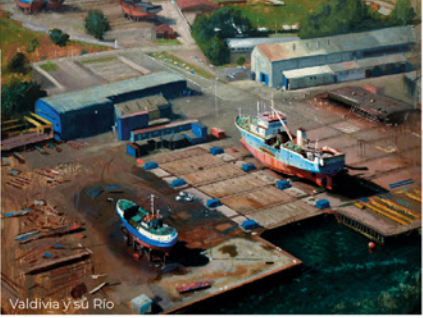
Valdivia y su Río