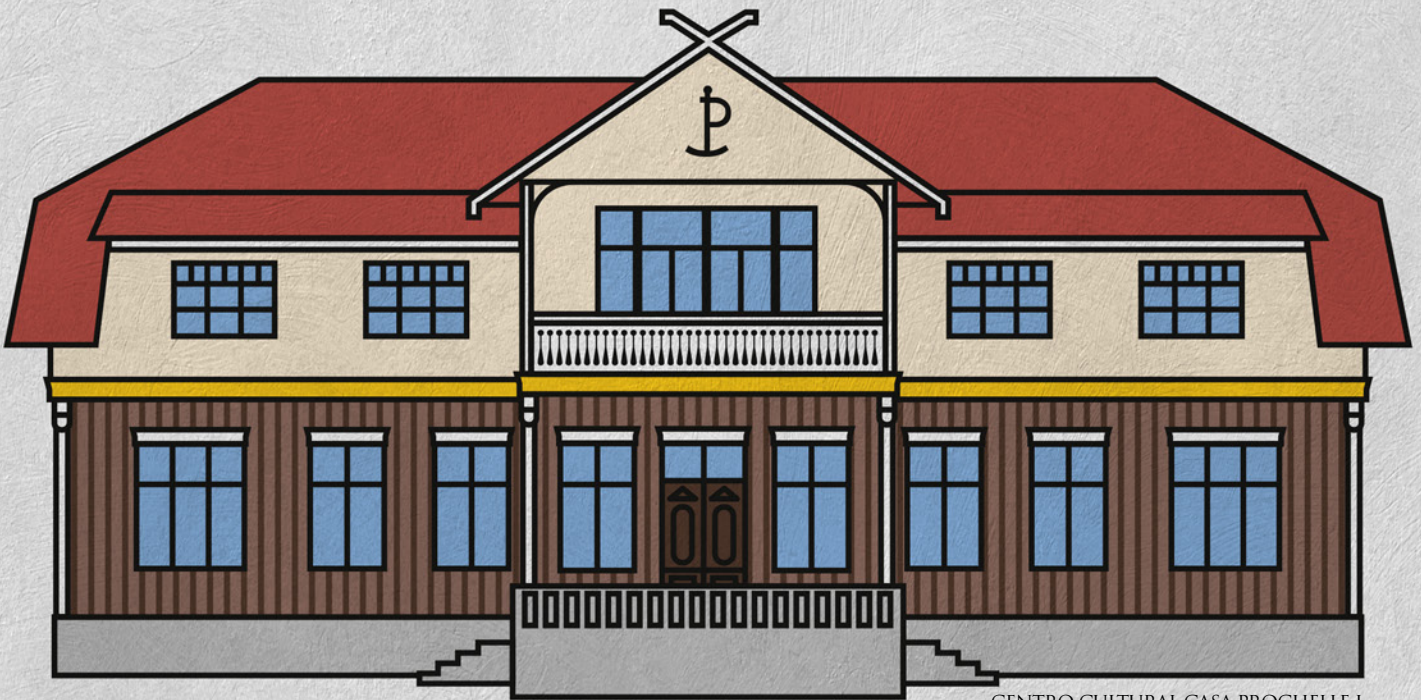
CENTRO CULTURAL CASA PROCELLE I

CORPORACIÓN CULTURAL MUNICIPAL / REVISTA KIMELCHÉN - MENSAJE A LA GENTE / OCTUBRE DE 2018 / AÑO 18 / Nº 213