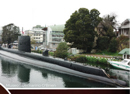
Museo Submarino O'Brien