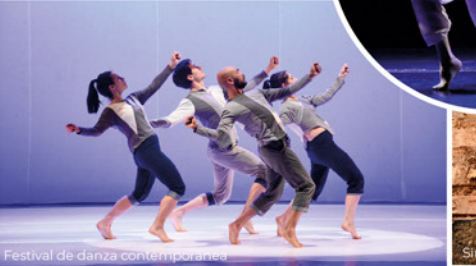
Festival de danza contemporánea