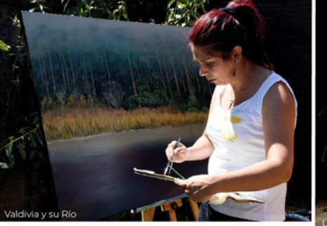
Valdivia y su Río