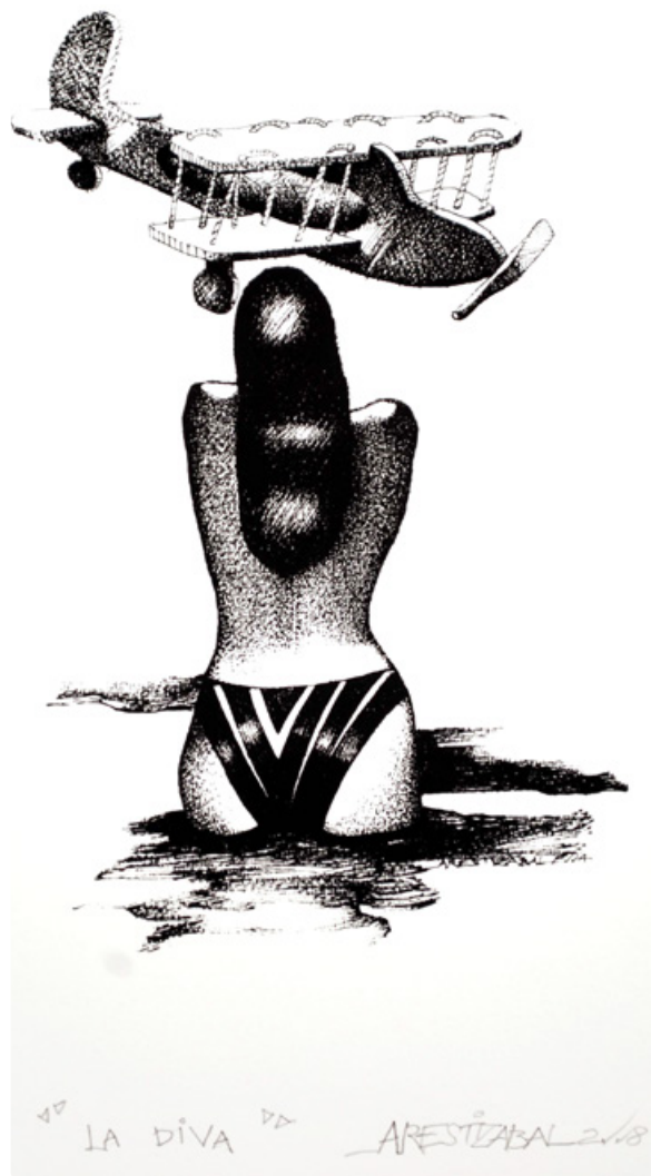
“La diva”, Germán Arestizabal.

Óleos, grabados, acuarelas, entre otras técnicas, de distintos artistas locales y nacionales realizadas entre 2002 y 2017 con motivos alusivos a la capital de Los Ríos, en su mayoría, estarán hasta el 10 de junio en la Sala de Bellas de Artes de la Universidad Diego Quispe Tito.