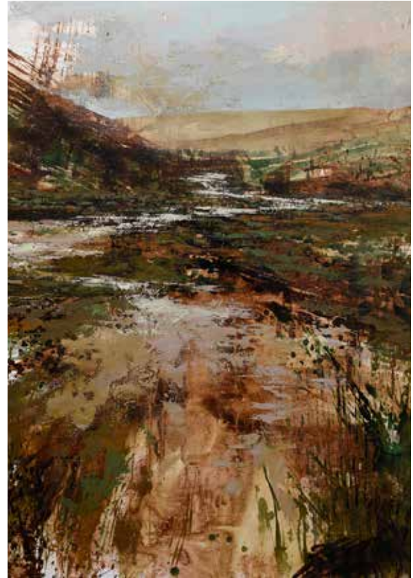
Tercer Premio In Situ, Mauricio Álvarez Collao, Los Vilos.

Las obras no deberán exceder de 1,20 x 1,20 m, ni ser inferiores a 0,90 x 0,90 m. En el caso de dípticos o trípticos, la suma de sus partes no deberá exceder esas medidas. El formato de las acuarelas no deberá ser inferior a 0,50 m en su dimensión mayor. Las dimensiones indicadas excluyen el ancho del montaje.