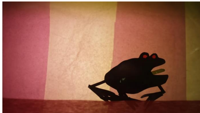
Kinesis – BORAJ