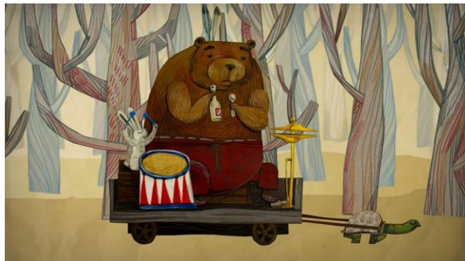
Paper plane – Giangrande

Muestra de obras audiovisuales para reforzar los contenidos.