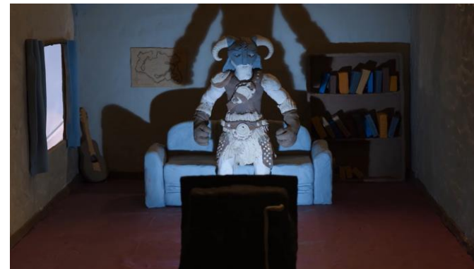
Skyrim Memories – Bethesda