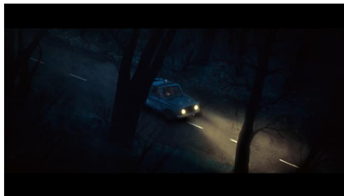
NightHawk – Špela Čadež